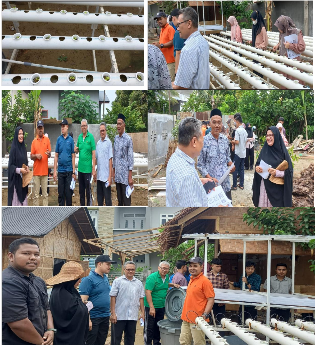
Gambar 2. Lokasi Pengabdian, Peserta Pelatihan, dan Mahasiswa