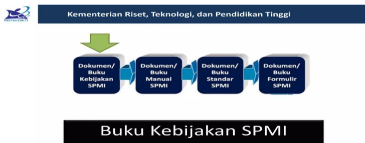
Gambar 2. Kebijakan Mutu