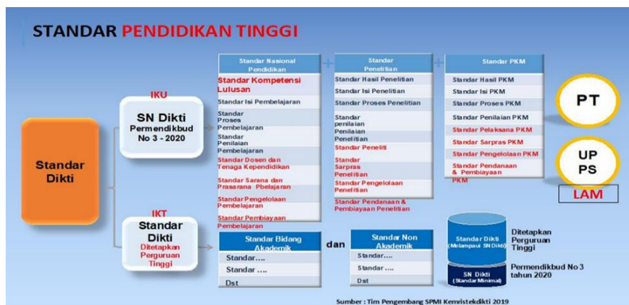
Gambar 1. Standar Pendidikan Tinggi