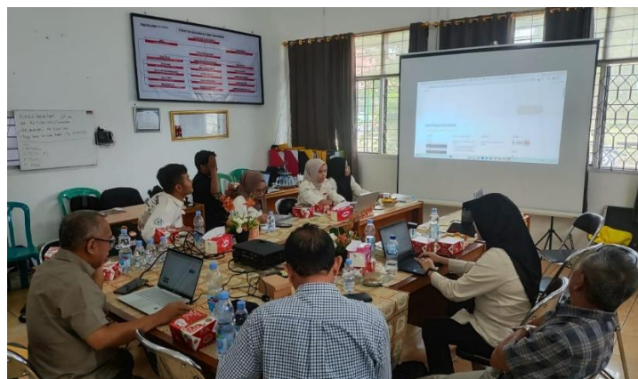
Gambar 4. Suasana Diskusi Penjaminan Mutu